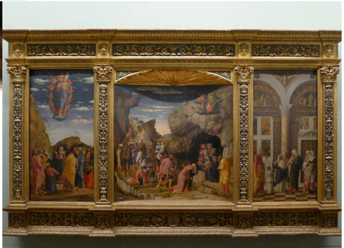
Andrea Mantegna - Trittico degli Uffizi - Firenze, Galleria degli Uffizi