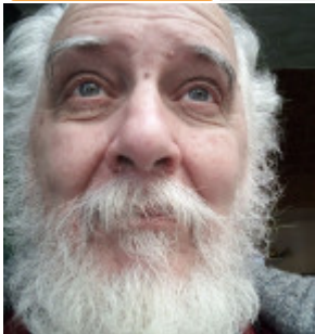
José Arturo Quarracino