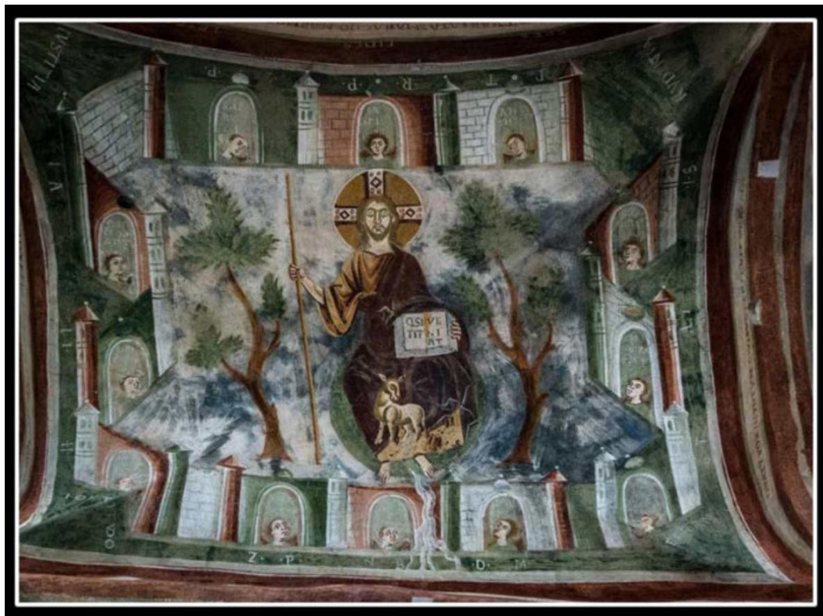
La Gerusalemme Celeste, Civate (LC) - Basilica di San Pietro al Monte

1995. Nei suoi monocromi, David Simpson interpreta la città apocalittica come luminosa rivelazione divina. I tre acrilici del pittore americano, che hanno la peculiarità di catturare e irradiare la luce grazie alla miscela di titanio e cristalli da cui sono composti, rievocano la Trinità attraverso i loro colori: l'oro, per indicare il Padre, il rosso, che richiama la regalità del Figlio, l'azzurro che suggerisce il soffio dello Spirito. Sono superfici riflettenti e sempre mutevoli, immagini dell'infinito nel finito. Gerusalemme è, qui, pura luce che ci introduce a un "oltre".