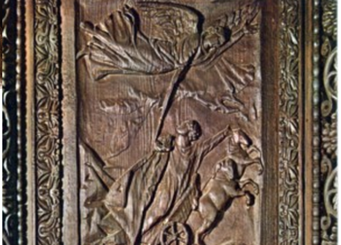
Il ratto di Elia, Roma - Basilica di Santa Sabina