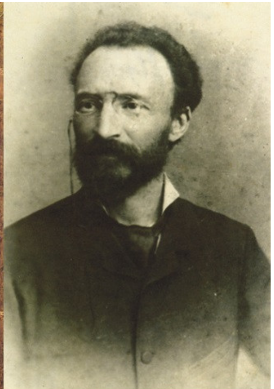
Bartolo Longo all'età di 35 anni

Grazie al via libera concesso da papa Francesco, lunedì 24 febbraio, al Dicastero delle Cause dei Santi, la strada verso la canonizzazione del beato Bartolo Longo (1841-1926) è ormai spianata. Come informa il sito dello stesso Dicastero , nell'iter speciale intrapreso