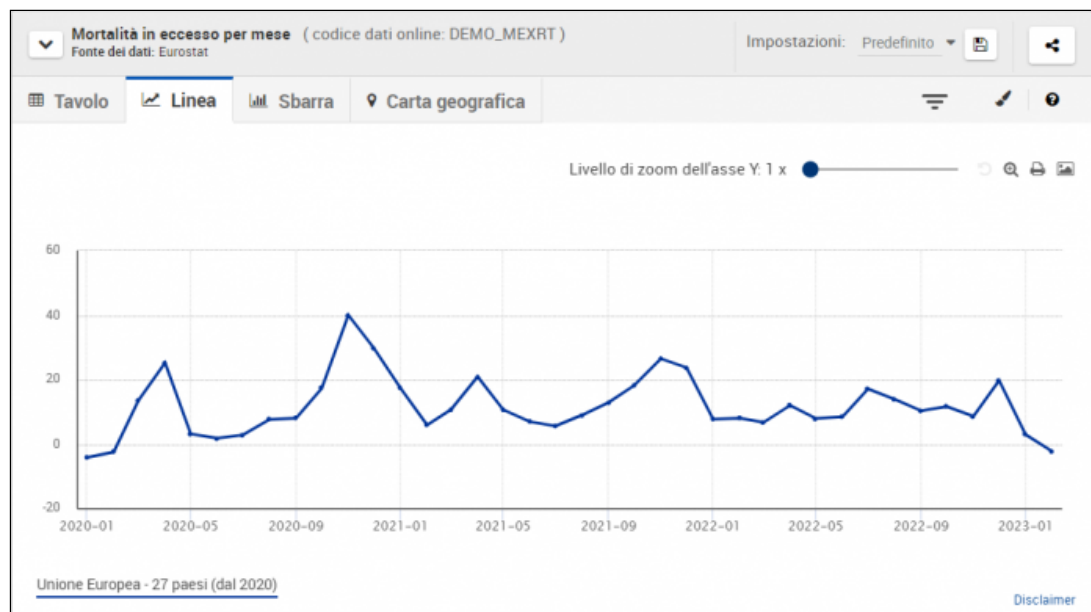
Grafico 1 (mortalità in eccesso nei 27 Paesi dell'UE)

Esaminando la curva della mortalità nei 27 Paesi dell'UE è possibile rilevare come, all'inizio della pandemia, vi sia stato un picco di decessi nell'aprile 2020 (con un eccesso di mortalità pari al 25,2%); poi la curva della mortalità discende e quindi risale alla fine del 2020 (con un eccesso di mortalità del 40,0% a novembre 2020); nel corso dell'anno 2021 la mortalità rimane superiore alla media degli anni precedenti (con due picchi di eccesso di mortalità del 20,9% in aprile e del 26,5% nel novembre 2021); nel 2022 la curva della mortalità rimane ancora stabilmente superiore alla media, con valori di eccesso di mortalità dell'8%-10% (con picco a fine dicembre 2022 che sfiora il 20%); nei primi mesi del 2023 la curva della mortalità decresce fino ad azzerarsi a valori pre-pandemia. Si noti che successivamente alla vaccinazione concentratasi nel 2021 non si è verificato un calo significativo della curva della mortalità, che anzi rimane alta per tutto il 2022.