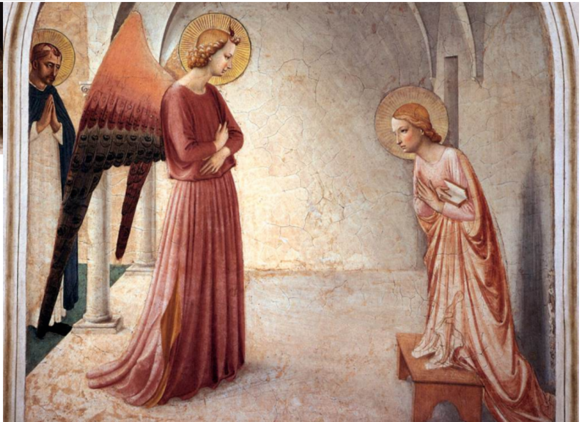
Beato Angelico, Annunciazione [detta "della cella 3"], Firenze - Museo di San Marco